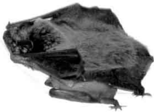
La Noctule de Leisler Mélanie avec ses petits (qui sont cachés sous ses ailes).

Un grand merci à cette dame passionnée qui a accueilli, soigné et élevé Mélanie et ses filles et qui nous a tenu au courant régulièrement de leur état de santé.