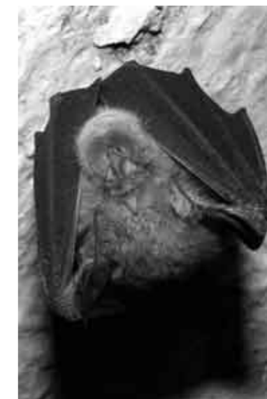
Grand Rhinolophe en hibernation.