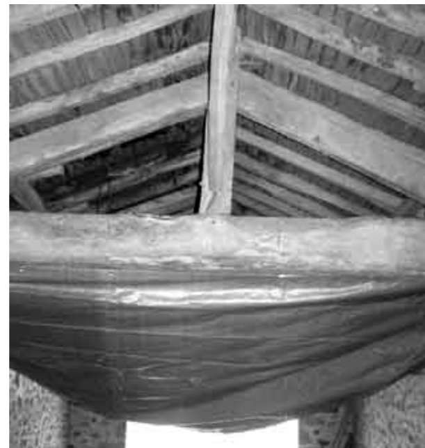
Une bâche a été posée pour récupérer le guano

P.S : Nous avons adapté le système de convention de gestion que l'on propose habituellement aux municipalités pour les particuliers ; il s'agit maintenant d'un « diplôme de l'ami des chauves-souris » qui possède les mêmes clauses mais sous une forme beaucoup moins austère. Il est consultable sur simple demande.