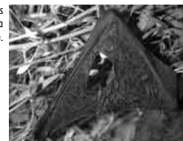
Le trou dans l'aile de la Pipistrelle.