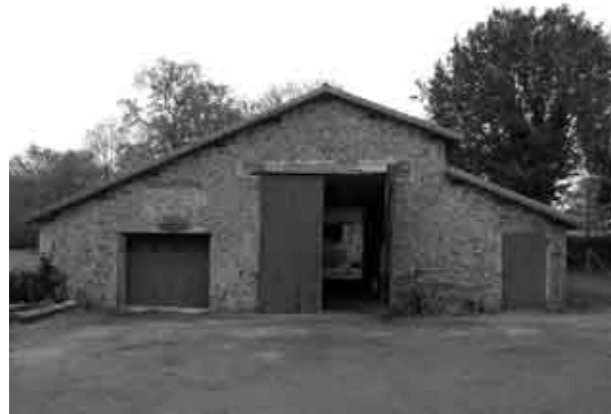
La grange qui sert de gîte aux chauves-souris et au camping-car avant travaux : co-habitation difficile !